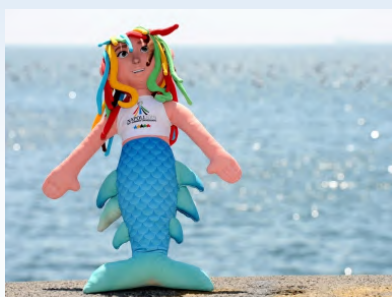
LA SIRENA PARTHENOPE

Nel corso di una conferenza stampa tenutasi all’hotel Royal Continental di Napoli, sono state svelate la fiaccola e la mascotte ufficiale delle Universiadi 2019.