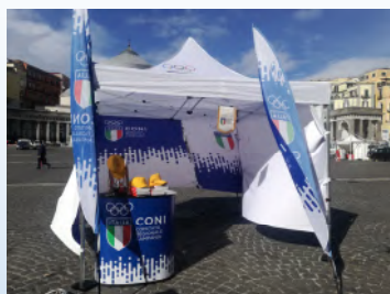
LO STAND DEL CONI

Il 12 aprile, in piazza del Plebiscito, è andata in scena la 7ª edizione di “Sii Saggio, Guida Sicuro”, una