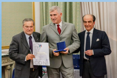
TALENTO, ROMA, AUTUORI