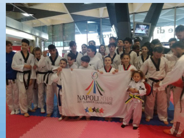
FOTO DI GRUPPO ATLETI