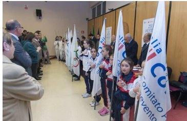
UN MOMENTO DELLA CERIMONIA