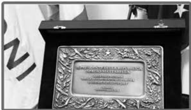
La targa del Presidente della Repubblica